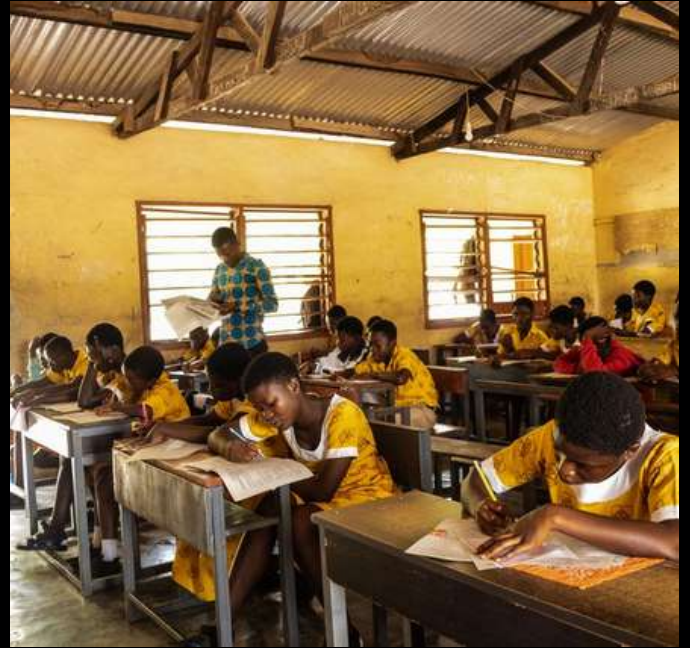
Visite d'une école